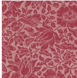
MALLOW WEAVE PLUM F1744/04