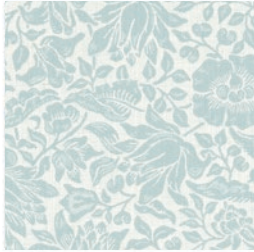
MALLOW WEAVE MINERAL F1744/03