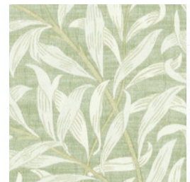
WILLOW BOUGHS JAC SAGE F1747/03