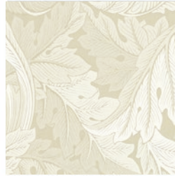
ACANTHUS JAC LINEN F1740/03