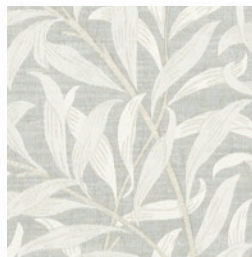
WILLOW BOUGHS JAC SLATE F1747/04