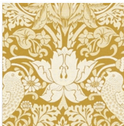
STRAWBERRY THIEF JAC CHAR F1746/01