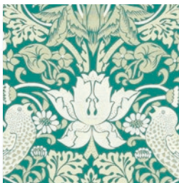
STRAWBERRY THIEF JAC TEAL F1746/06