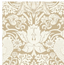
STRAWBERRY THIEF JAC LINEN F1746/03