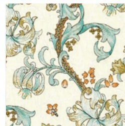
GOLDEN LILY EMB LINEN/TEAL F1742/03