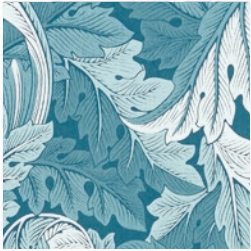
ACANTHUS JAC DENIM F1740/01

Cette collection lancée cet automne-hiver 2024 rend hommage à l'univers de William Morris. Troisième collection capsule imaginée pour Clarke & Clarke, inspirée par l'œuvre intemporelle de William Morris, elle s'intitule « William Morris Weaves ». Elle célèbre l'esprit éclectique du style britannique cher à Clarke & Clarke, réinterprétant avec audace quelques-uns des motifs les plus emblématiques de Morris. En mariant une palette de couleurs fraîche et moderne à des dessins iconiques subtilement retouchés et redimensionnés, ces tissus révèlent une nouvelle élégance, conjuguant héritage et modernité.