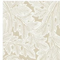
ACANTHUS WEAVE IVORY F1741/03