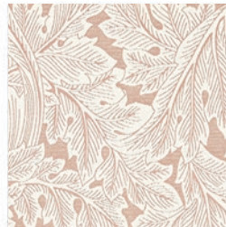
ACANTHUS WEAVE BLUSH F1741/01