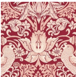
STRAWBERRY THIEF JAC PLUM F1746/05