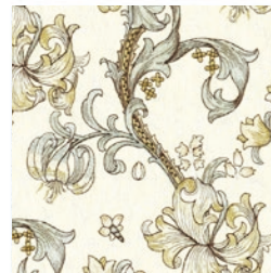
GOLDEN LILY EMB DOVE F1742/01