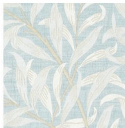
WILLOW BOUGHS JAC DENIM F1747/01