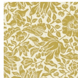
MALLOW WEAVE CHAR F1744/01