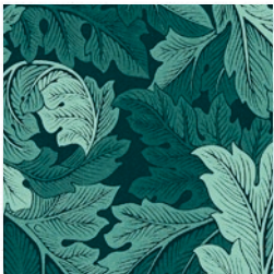
ACANTHUS JAC TEAL F1740/06