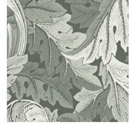
ACANTHUS JAC SLATE F1740/05