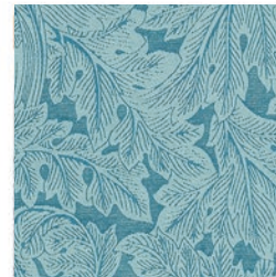
ACANTHUS WEAVE DENIM F1741/02