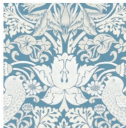
STRAWBERRY THIEF JAC DENIM F1746/02