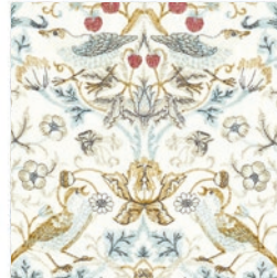
STRAWBERRY THIEF EMB DENIM F1745/02