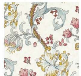
GOLDEN LILY EMB PLUM/DEN F1742/04