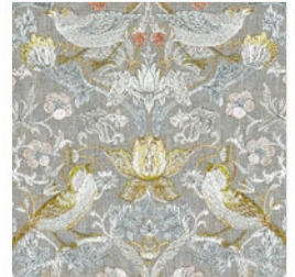
STRAWBERRY THIEF EMB SL/BLU F1745/03