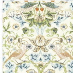
STRAWBERRY THIEF EMB AP/BLU F1745/01