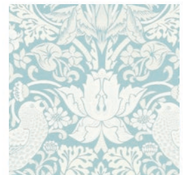
STRAWBERRY THIEF JAC MIN F1746/04