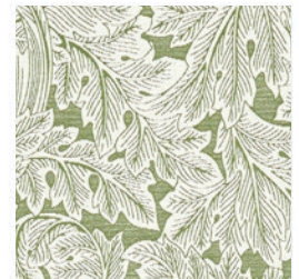
ACANTHUS WEAVE SAGE F1741/04