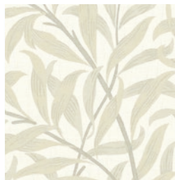
WILLOW BOUGHS JAC LINEN F1747/02