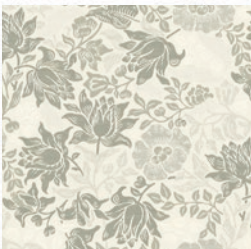
MALLOW JAC DOVE/ SLATE F1743/01