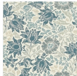
MALLOW JAC MID/DEN F1743/02