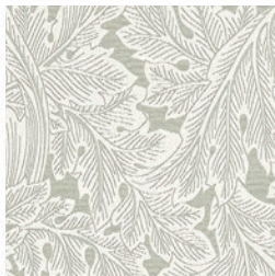
ACANTHUS WEAVE SLATE F1741/05