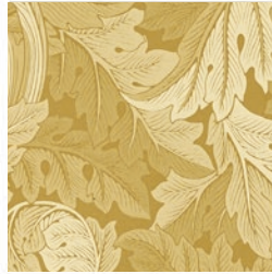
ACANTHUS JAC GOLD F1740/02