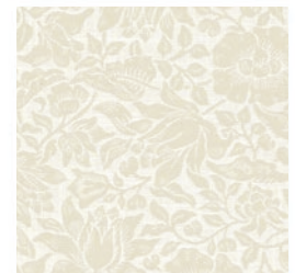
MALLOW WEAVE LINEN F1744/02