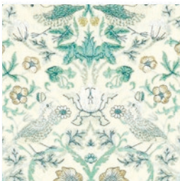
STRAWBERRY THIEF EMB TEAL F1745/04