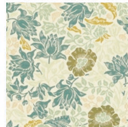
MALLOW JAC MIN/CHAR F1743/03