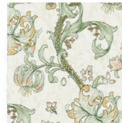
GOLDEN LILY EMB LINEN/BLU F1742/02