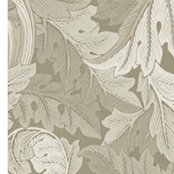
ACANTHUS JAC NATURAL F1740/04