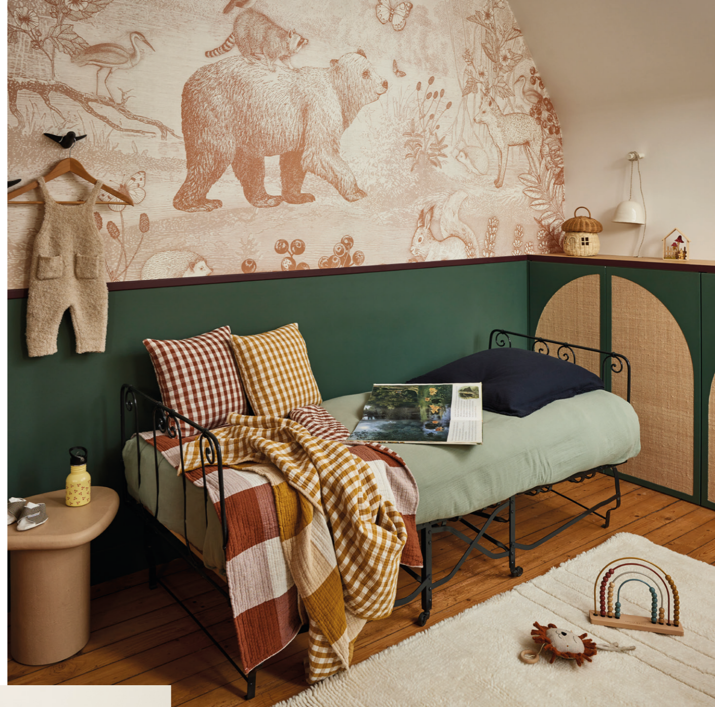
10. Housse de coussin Louisine - coloris naturel et pastel - coton appliqué et rebrodé - 28x47 cm - 65€