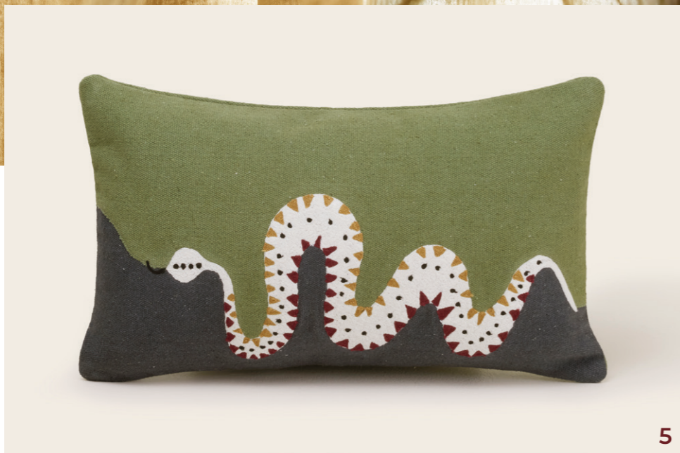
5. Housse de coussin Teoti - coloris vert et python doré - coton rebrodé en chaînette - 28x47 cm - 39€