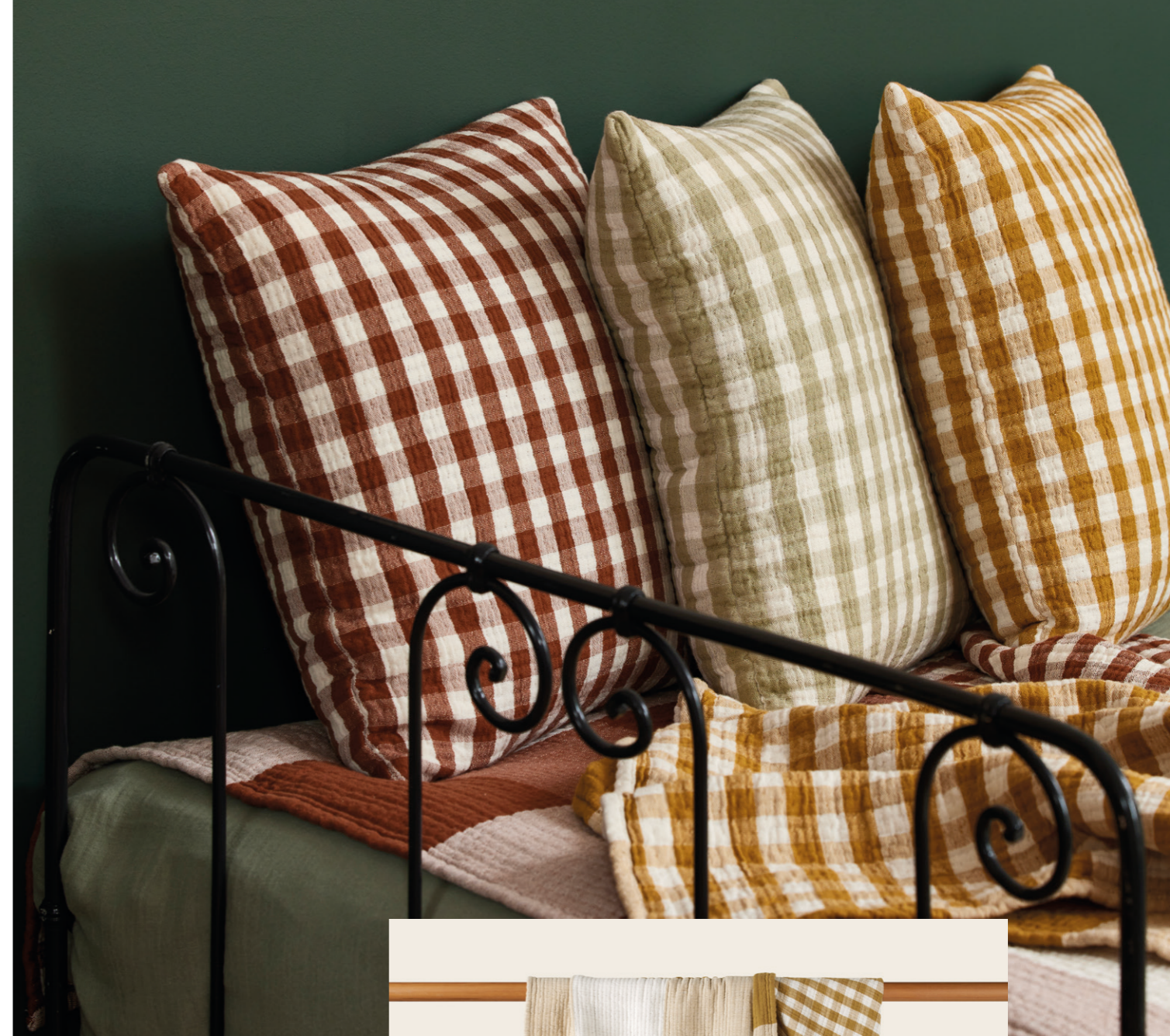
2. Housse de coussin Jeanie - coloris vert olive douce - double gaze de coton gaufrée en vichy - 40x40 cm - 45€