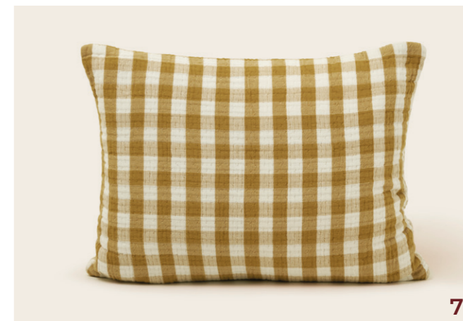
7. Housse de coussin Jeanie - coloris jaune ocre - double gaze de coton gaufrée en vichy - 30x40 cm - 39€