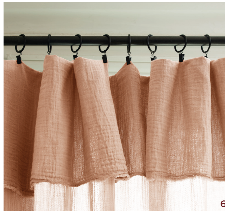
6. Panneau Lou - coloris jaune paille et pêche rosé - gaze de coton unie et frangée - certifié Oeko-Tex® - double épaisseur - 145xH280 cm - 129€