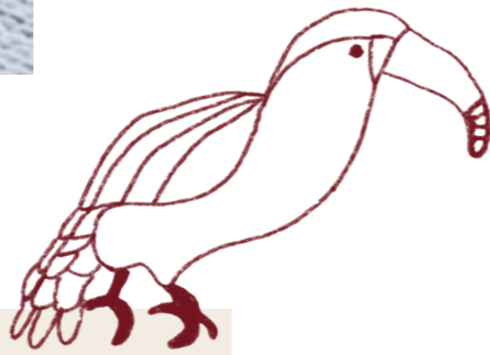
18. Housse de coussin Tigris - coloris encre - coton rebrodé de point de chaînette au motif animalier - 28x47 cm - 45€