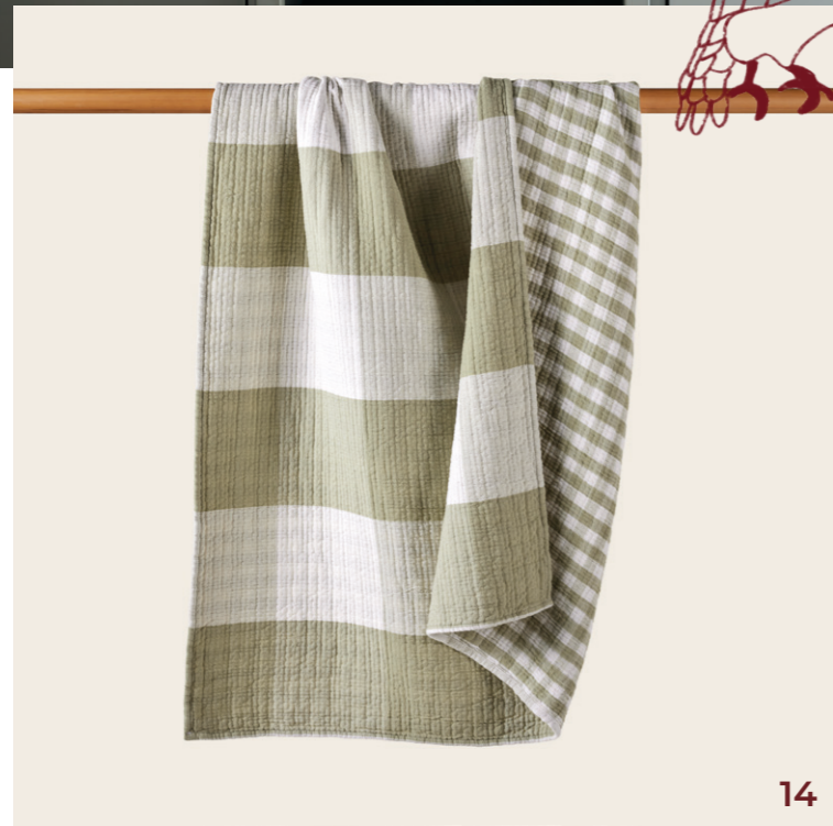
14. Plaid Jeanie - coloris vert olive douce - double gaze de coton gaufrée à carreaux réversible - 100x140 cm - 69€