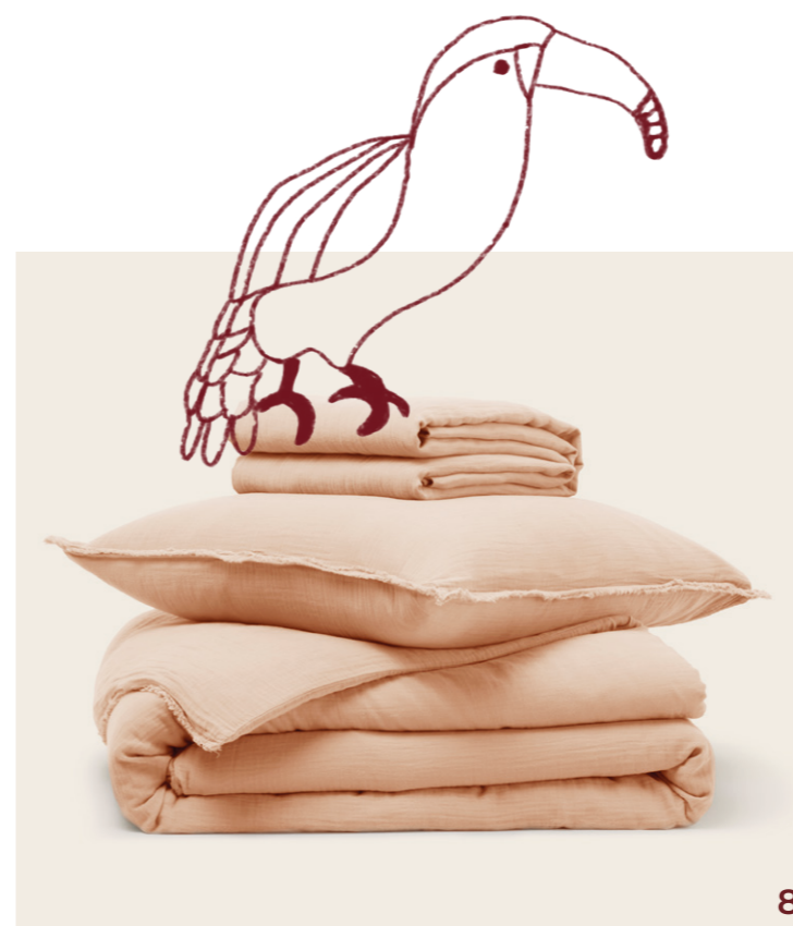
8. Parure de lit Lou - coloris pêche rosé - gaze de coton unie et frangée - certifié Oeko-Tex® - fermeture par boutons nacrés invisibles - double épaisseur - housse de couette 100x140 cm + un drap housse en 70x140 cm + 2 taies d'oreiller en 40x40 ou 30x40 cm - 183€ (la parure existe aussi avec des housses de couette en 140x200cm)