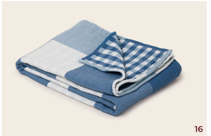
16. Plaid Jeanie - coloris bleu orage - double gaze de coton gaufrée à carreaux réversible - 100x140 cm - 69€