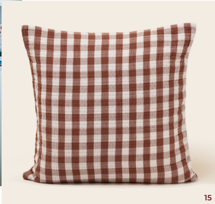
15. Housse de coussin Jeanie - coloris mocha - double gaze de coton gaufrée en vichy - 40x40 cm - 45€