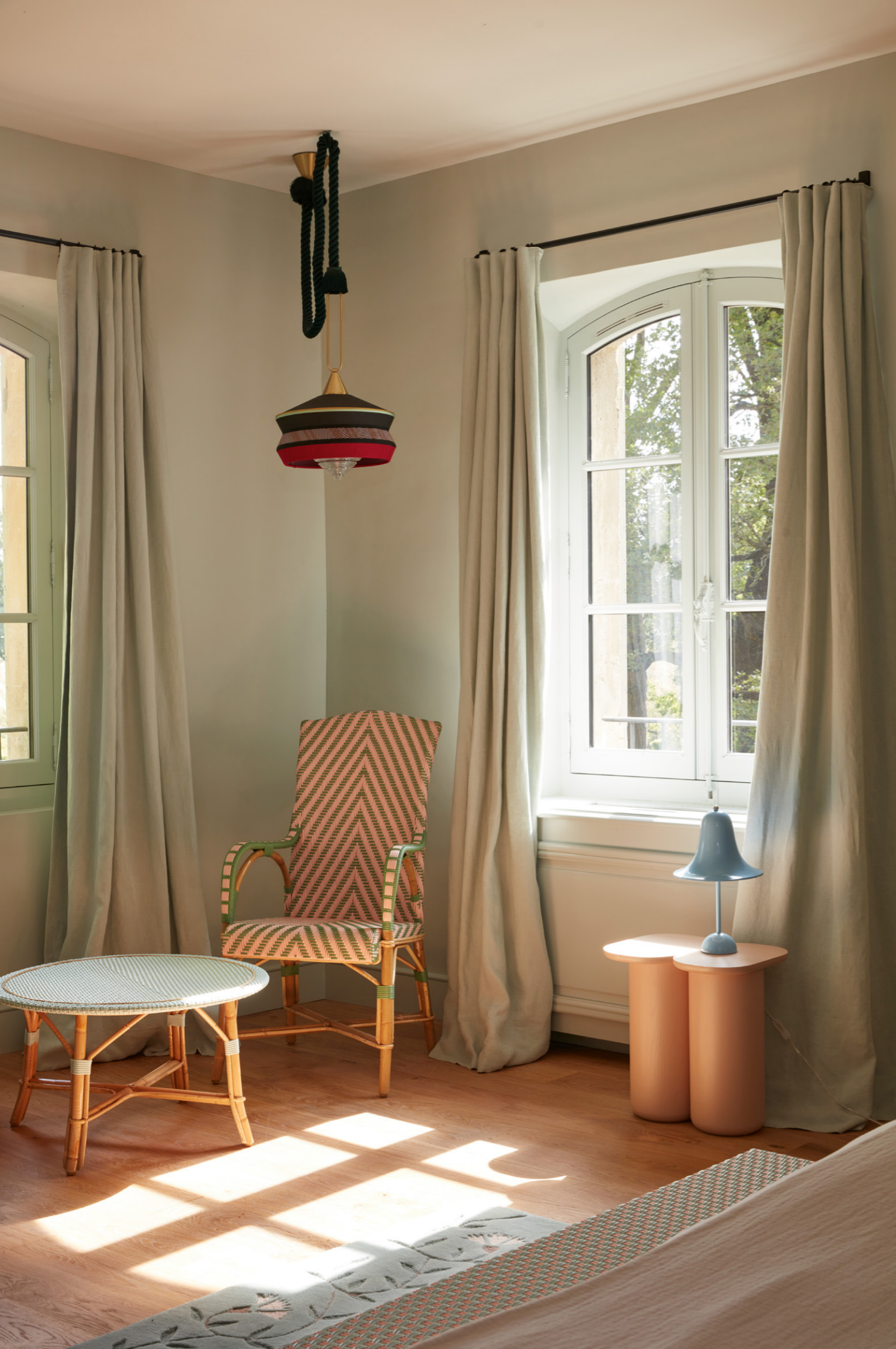
16. Chaise haute Fouquet's - sur mesure - rotin et fibre personnalisables - à partir de 703€ 17. Chaise Rive Gauche - sur mesure - rotin et fibre personnalisables - 694€