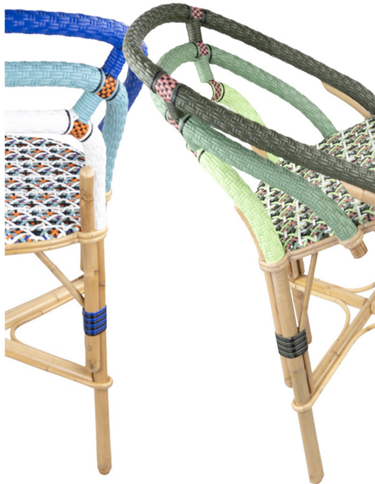
Maison L. Drucker x BrichetZiegler - La chaise «Valmy»