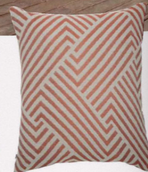
BAYADÈRE GLAMOUR Coussin « Deyo » en polyester, L. 40 x P. 6 x H. 40 cm, Atmosphera , 8,99 €.