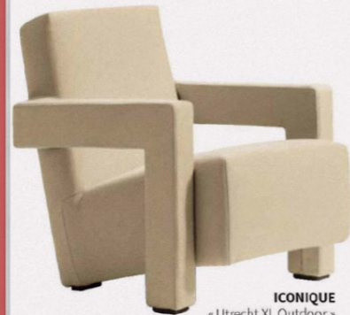
ICONIQUE « Utrecht XL Outdoor » en ouate de PET recyclé, L. 66 x P. 89 x H. 77 cm, Cassina, à partir de 4528 €.